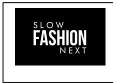
SLOW FASHION NEXT